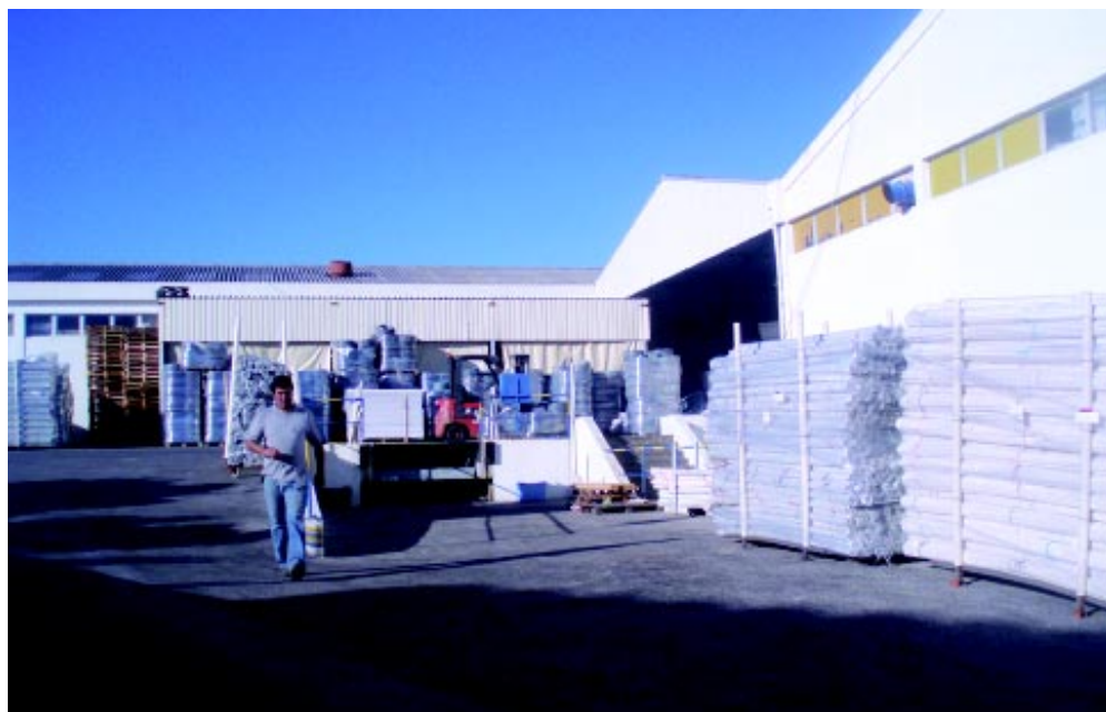
Vista geral das instalações da empresa, nos dias de hoje